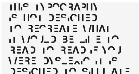
Так видит текст дисграфик